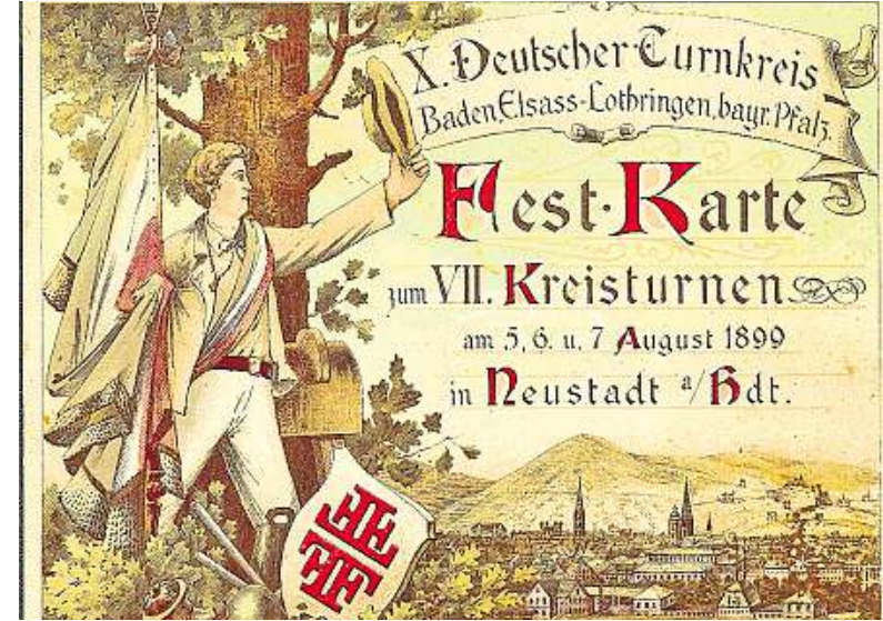
Seit jeher war den Sportvereinen nicht nur die Leibesertüchtigung wichtig, sondern auch das gemeinsame Feiern, wie diese Festkarte von 1899 zeigt.

oder in feuchten Kellern zu vergraben“, erklärt Ehlers, weshalb das IfSG stets darum werbe, Vereinsarchive anzulegen. Wie eine solche Sammlung bestenfalls aussieht, können die Teilnehmer ebenfalls anhand eines Beispiels