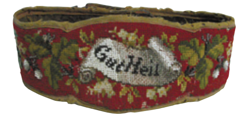
Gestickter Turner-Prunkgürtel, 2. Hälfte des 19. Jh.

Senden Sie die Anmeldung bitte ausreichend frankiert an das Institut für Sportgeschichte Baden-Württemberg e.V. Postfach 47 75429 Maulbronn Tel.: 07043 / 103-16 Fax: 07043 / 10345 E-mail: ifs@maulbronn.de / www.ifs-gbw.de